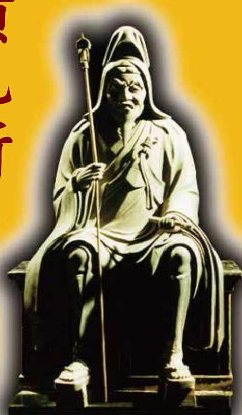
修験道開祖 役行者