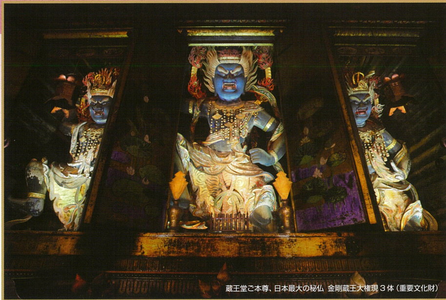
蔵王堂ご本尊、日本最大の秘仏 金剛蔵王大権現3体(重要文化財)

■拝観時間／午前8時30分～午後4時 ■特別拝観料(団体割引あり)／大人1,600円 中高生1,200円 小学生800円